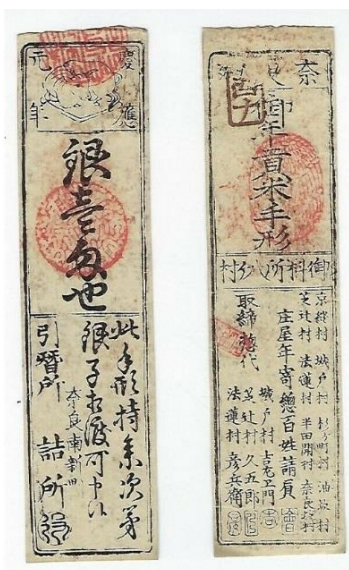
Japón: hansatsu Circa 1850. Tamaño: 15,8 x 4 cm. Uncirculated (Adquirido en California - EEUU).