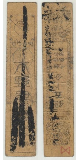
Japón. Periodo Edo: hansatsu Plata monme 17-18th Century . Tamaño: 11,5 x 2,3 cm. escasa nota de divisas XF (Adquirido en Chennai - India)