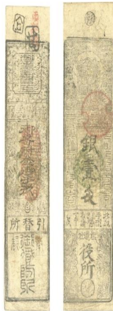
Japon: Billete HANSATSU 1 rin año 1872 catalogo numero S101. Tamaño: 3,6 x 15 cm. Estado MB. (Adquirido en Casa KURCHAN – CABA – Argentina)