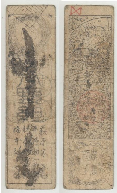
Japón. Periodo Edo: hansatsu Plata monme 17-18th Century . Tamaño: 12 x 3,3 cm. Escasa nota de divisas XF (Adquirido en Chennai - India)